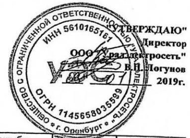
График капитального ремонта КВЛ-10кВ на 2020 год